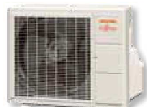
ASYG 7 à 12 LLCC