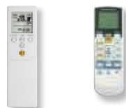
Infra-rouge (série) Infra-rouge (série) (Modèles LMC) (Modèles LFC)