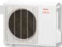
ASYG 18 LFC et 24 LFCC