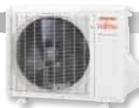
ASYG 7 à 14 LMC